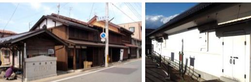
「大慈清水」と盛岡町家の街並み

江戸から明治期にかけて北上川舟運の起点、街道が交る要衝の地、城下の南の玄関口として栄えた地域です。現在も盛岡町家、舟運時代の土蔵、自然風土が育む緑と清水、寺院群などの歴史施設や街並みが残り、城下町の歴史風情とともに人々の暮らしが息づいています。盛岡の暮らし文化の歴史を伝える貴重な盛岡町家及び街並みと、人々の暮らしの営み、歳時記イベントなど、かけがえのない盛岡のまちの財産が守り繋がれています。