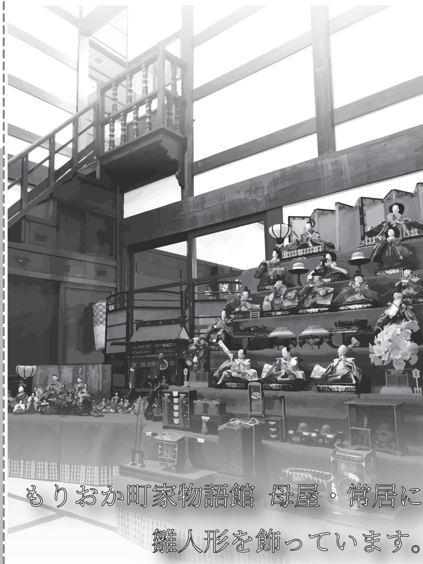
もりおか町家物語館 母屋・常居に 雛人形を飾っています。