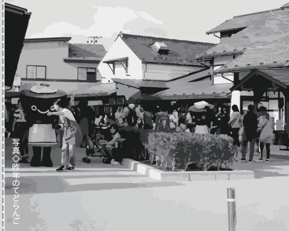
写真◇昨年のてどらんご