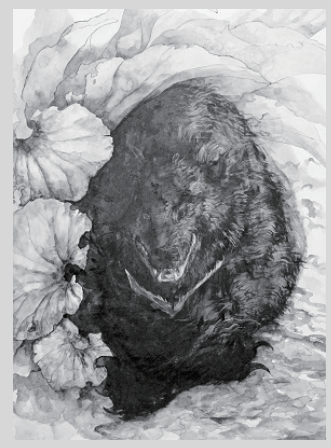
〈露と熊〉深澤口知見

深澤口知見・ふかさわぐちともみ 1992年茨城県生まれ。2014年東北芸術工科大学芸術学部美術科日本画コース卒業。2017年岩手県に移住。2018年にはカフェ DOMAにて個展「山に棲む」を開催。