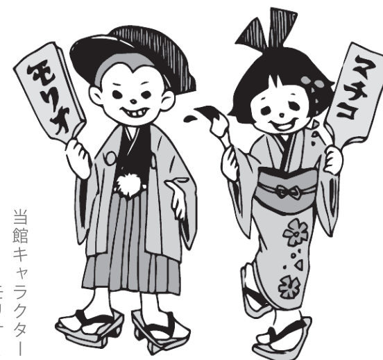
当館キャラクター モリオくん & マチコちゃん