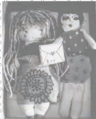
LETTER展 おやぎさんから(高田せい子) (土井幸子)～(高田せい子)