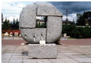
藁谷 収 「古代へーⅢ」