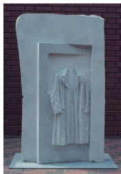
有馬 辰樹 「存在の跡」