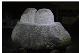
菅原 睦 「Isolation」