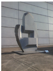
藤川 健 「生命の断片No.38」