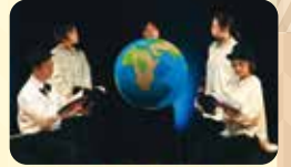
2023年1月開催 「歌と語りで綴る田中館愛橋物語」

実施日時 9/2(土)、9/3(日) 各日とも開演 14:00 会場 もりおか町家物語館・浜藤ホール 料金 ¥1,000 定員 80名 内容 橋不染著『もりおか明治船来づくし』、松本源蔵著『わたしの盛岡』の2