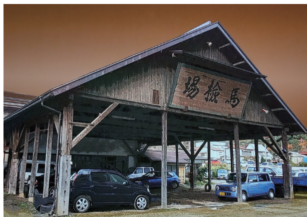
作品タイトル：「車は馬に」