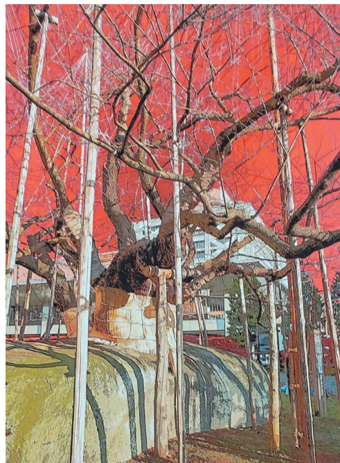
作品タイトル：「夕映え桜と化す」

今回の展示では、高橋氏の盛岡への愛が詰まった「真景錦絵」を展示します。高橋氏の手によって生み出された、盛岡の美しい街並み、見慣れた盛岡の景色や、今はもう見るできない懐かしい盛岡の風景作品を、ぜひご覧下さい。