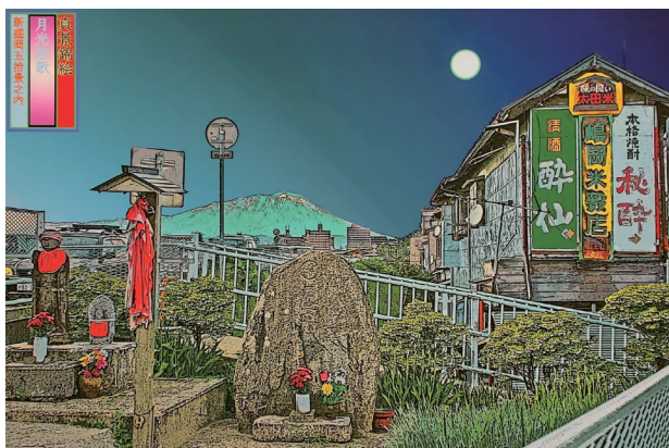
作品タイトル：「月光悲歌」