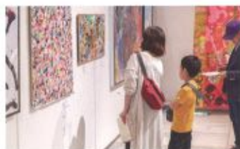
「第5回Art to You!東北障がい者芸術全国公募展」会場風景