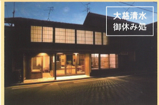
大慈清水 御休み処