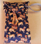
ネクタイ 小物入れ