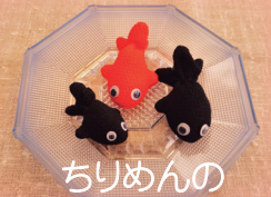
ちりめんの 三金魚