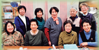
着物リメイクのメンバー