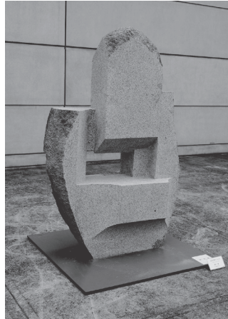
藤川健 「生命の断片 No. 38」